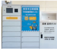
◀ JR西宮駅の受取ロッカー

市は、JR西宮駅自由通路と上甲子園センターに予約図書受取ロッカー、返却ポストを設置しました。図書館・分室で用意ができた予約本を、各館へ取りに行くことなく、受け取ることができます。