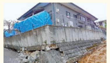
地震の影響で擁壁が崩れ、傾いた家