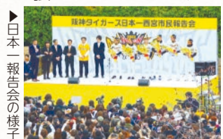
日本一報告会の様子

そう考えると、冬の冷たい六甲おろしもありがたく思えます。特にタイガースが日本一となった今年は、さっそうとその風を受けていこうと思えます。今年もあとわずか、引き続き頑張ってください！