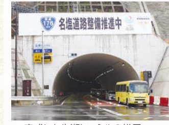
▲ 完成した生瀬トンネルの様子

江戸時代の生瀬村は公用の人や馬を備えた「宿駅」に指定され、丹波や播磨と摂津を結ぶ宿場町として栄えました。当時の村の総戸数の大半が宿駅業務に携わっており、武庫川沿いの急峻な地形の地域を旅する上で、重要な土地と位置付けられていました。武庫川のこの流域では、春に地域の人たちの手によって、稚鮎が放流されているそうです。昔の人たちは、生瀬の宿場町から武庫川に沿って旅をしていた際、川を元気に泳ぐ鮎の姿を目にしていたかもしれません。鮎がすいすい泳ぐように、地域の交通事情もすいすいと進んでいくよう、引き続き頑張っていきたいと思います。