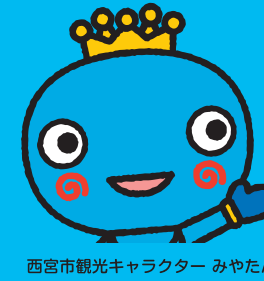
西宮市観光キャラクター みやたん