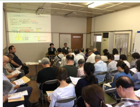
【再開発組合設立等の説明会の様子】

①転出希望の申出について、再開発ビル内での配置や評価が決まっていないのに、権利変換か地区外転出かの判断はできない。